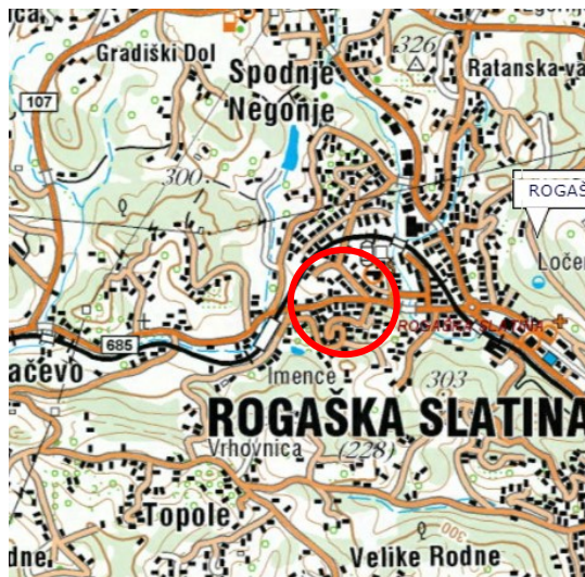
Slika 4: širši prikaz v prostoru – topografija

Območje obravnave se nahaja v zahodnem delu naselja Rogaška Slatina v Ratanski vasi.