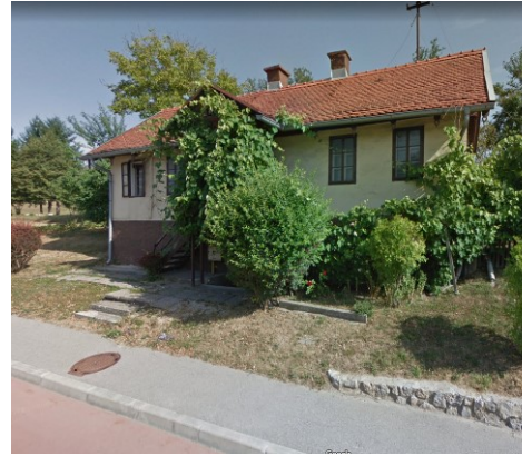
Slika 7: pogled na staro stanovanjsko stavbo z južne smeri (vir: www.google.com/maps )