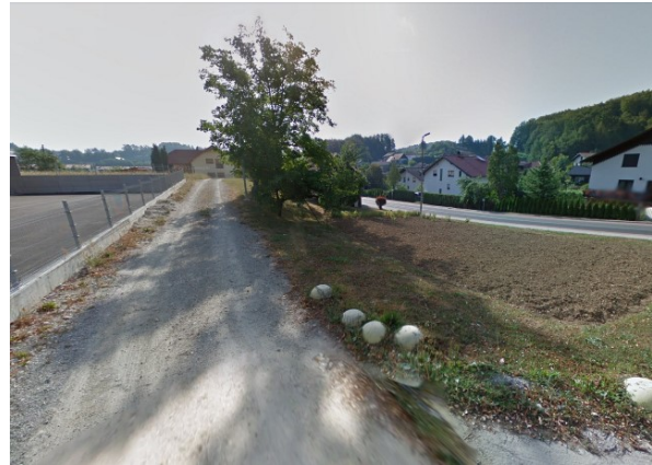
Slika 9: pogled na območje z zahodne smeri