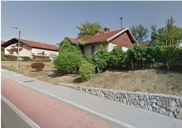
Slika 8: pogled na območje z jugovzhodne smeri