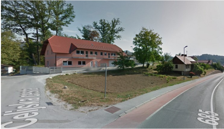
Slika 6: pogled na območje z jugozahodne smeri