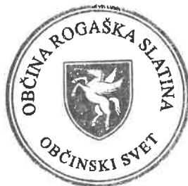
mag. Branko KIDRIČ ŽUPAN

Načrt ravnanja s stvarnim premoženjem občine za leto 2024 se dopolni s predhodno sprejetima sklepoma Občinskega sveta Občine Rogaska Slatina št. 0320-0004/2022-12 z dne 30. 3. 2022 in št. 0320-0004/2022-16 z dne 30.3.2022.