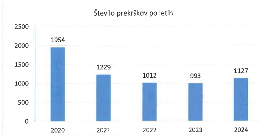
Tabela 2: gibanje števila prekrškov po letih